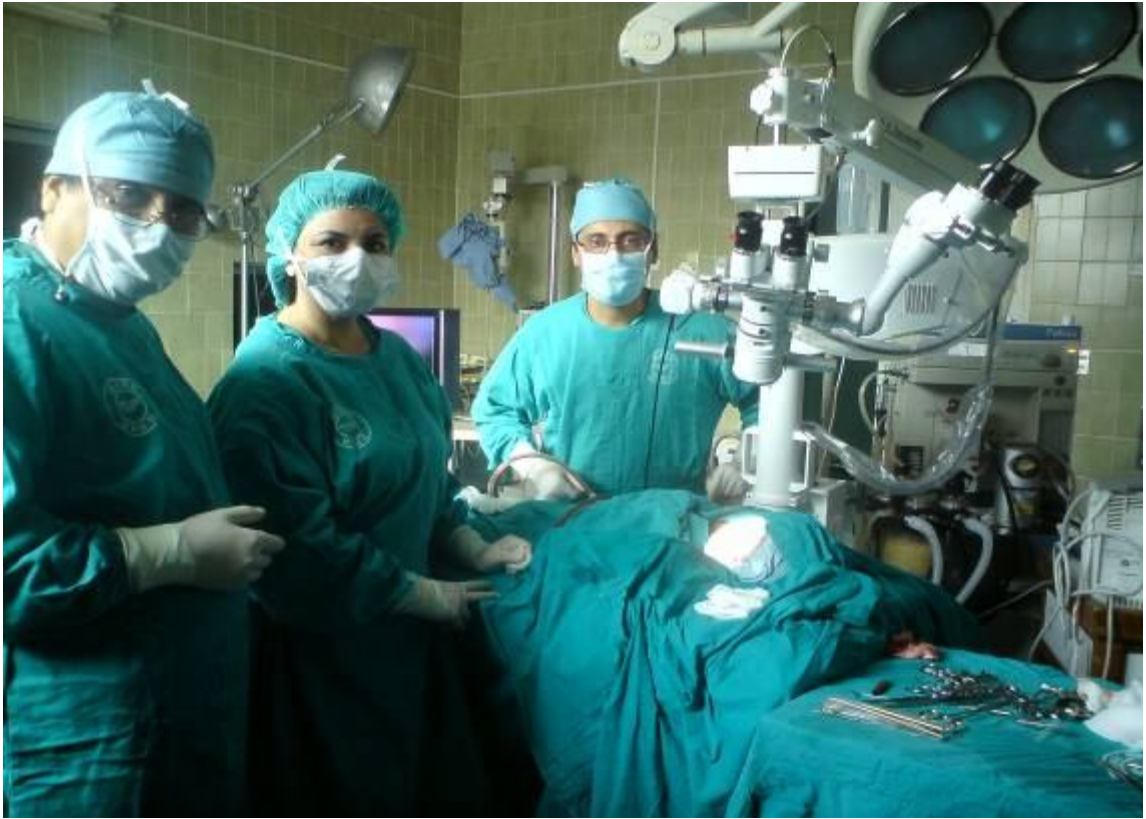
Equipo de Cirujanos del Hospital Hipólito Unanue, que realizó el implante coclear.