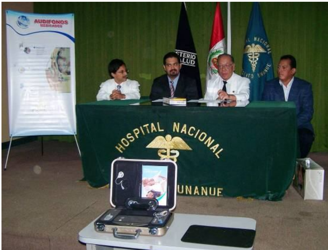
Donación del Implante Coclear por parte de la Compañía Cochler y Panadex.