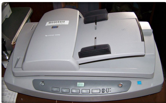
Scanner hp scanjet 5590