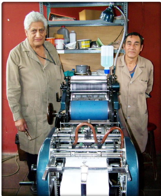
Reparación integral de la Maquina Offset Multilith 1250