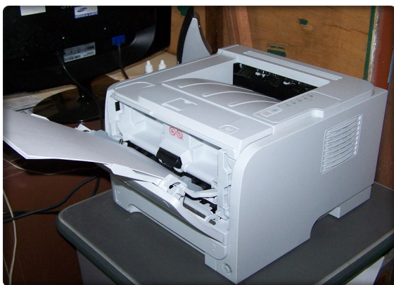
Impresora HP LaserJet P2035