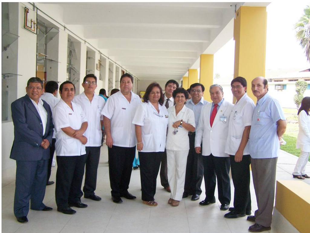
Equipo de Neumólogos del Hospital Nacional Hipólito Unanue y Representantes de la Dirección de Salud IV Lima Este.