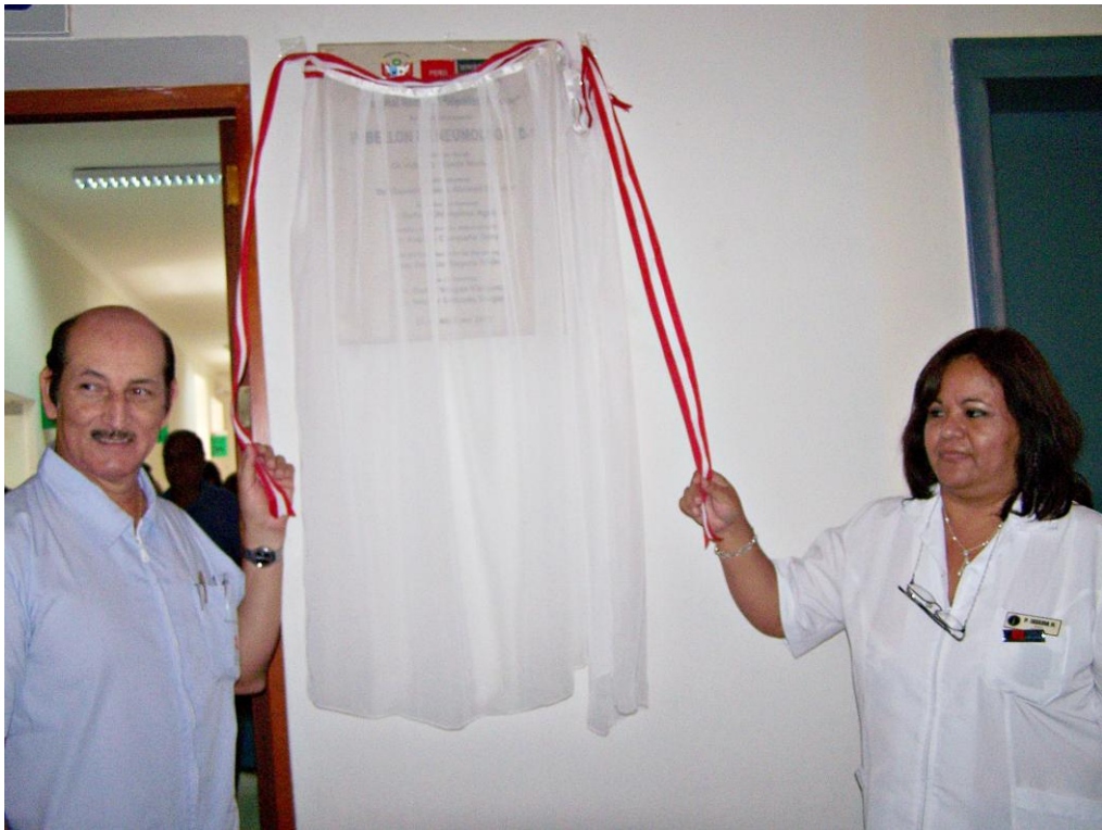
Develación de Placa Recordatoria del Pabellón D-1