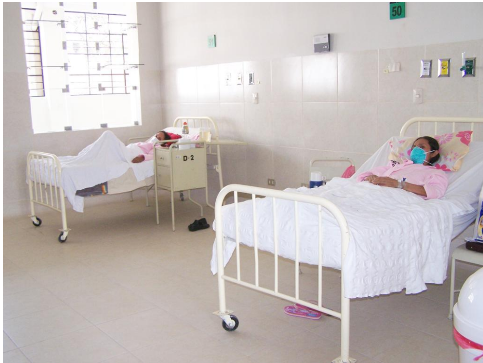
Ambientes de Hospitalización Mujeres