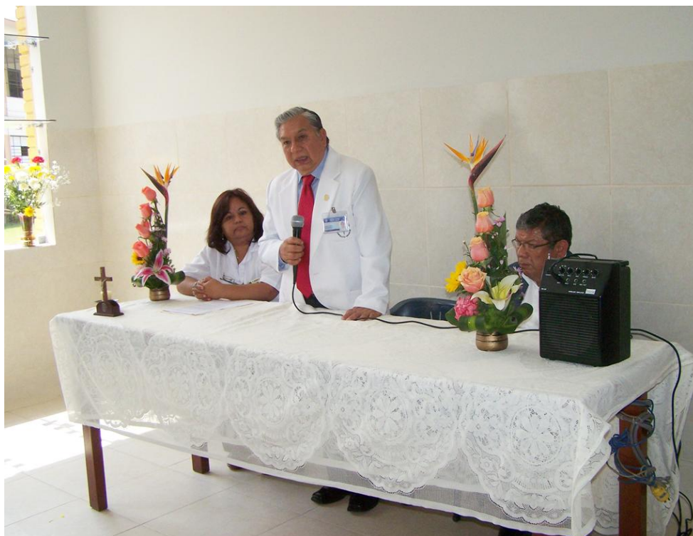
Ceremonia de Inauguración

La remodelación del pabellón de abarcó trabajos de: Estructuras, Arquitectura, Instalaciones Sanitarias, Instalaciones Mecánicas e Instalaciones Eléctricas, abarcando un área de 1380.05 m 2 .