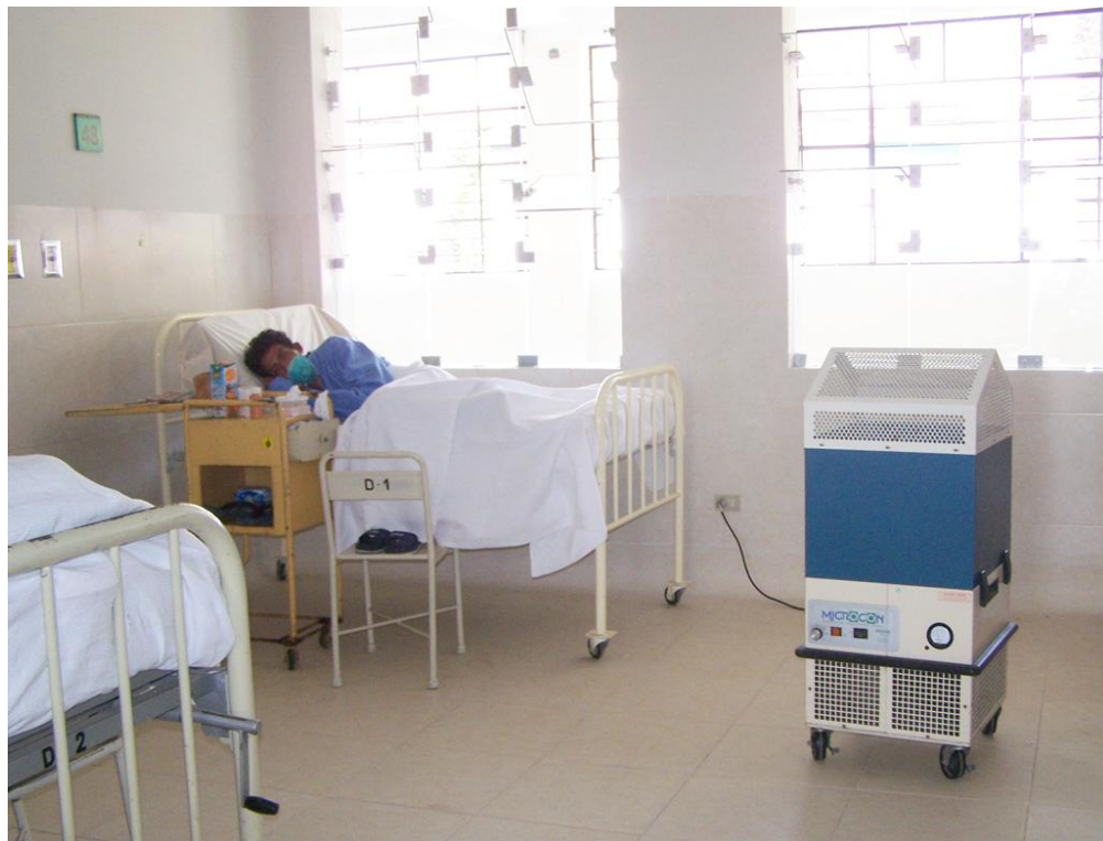
Ambientes de Hospitalización de Varones con Purificadores de Aire HEPA