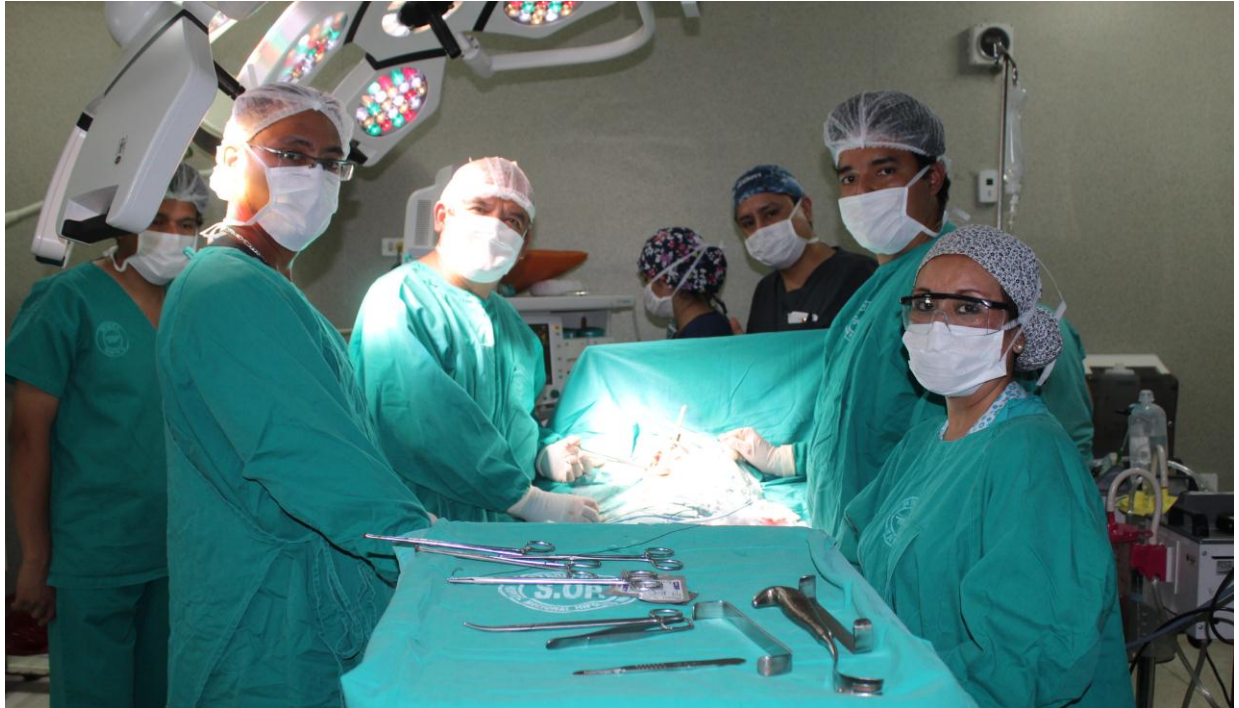
Médicos y personal asistencial del Departamento de Cirugía de Tórax y Cardiovascular del HNHU